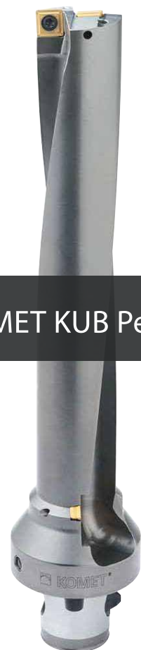
KOMET KUB Pentron®

SPECJALNE CENY DLA NASZYCH PARTNERÓW SKONTAKTUJ SIĘ Z NAMI: