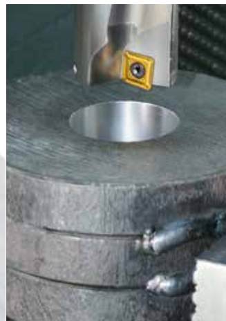
wiercenie w napoinie lub na powierzchni falistej