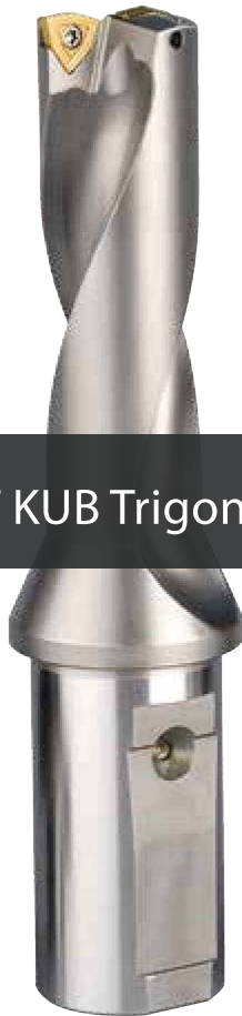
KOMET KUB Trigon®

Gwarancja precyzji, jakości i wysokiej wydajności