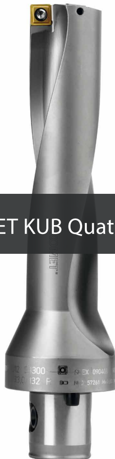
KOMET KUB Quatron®